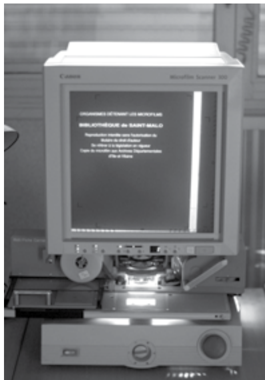
Lecteur de microfilm