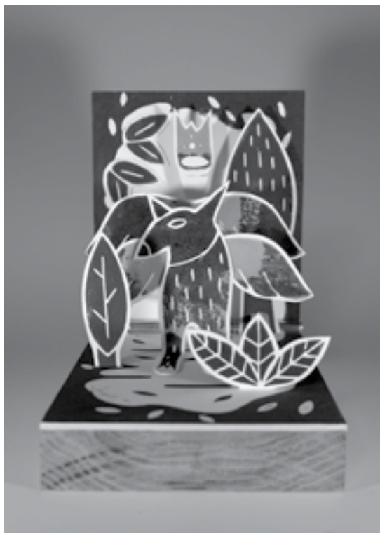
Pop-up ( Forget Christophe )