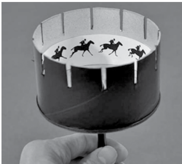
Zootrope ( cutoutfoldup.com/1108-zoetrope.php )